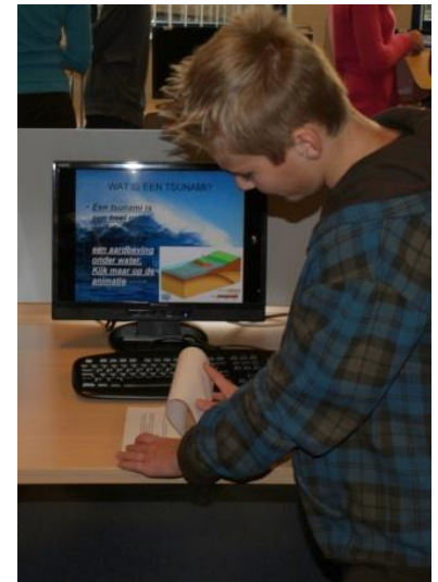
Pim: "Zo bouwt een Tsunami zich op"

Voor vwo-plusleerlingen hebben we een aangepast lesrooster, waardoor je sneller door de "gewone" lessen heen gaat. De vrijgekomen tijd wordt ingevuld met andere uitdagende onderwerpen, die niet in de gewone vakken voorkomen.